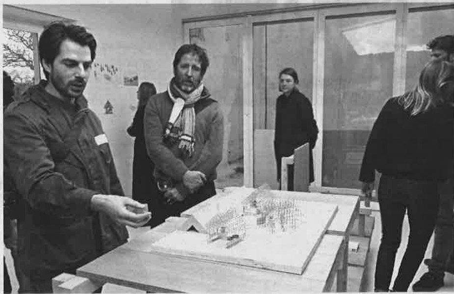
L'équipe d'Usus explique son projet élaboré lors d'une résidence.

L'objectif de ce projet est de permettre aux randonneurs de pouvoir partir à travers les PNR et ce, sur plusieurs