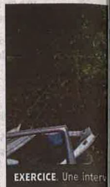
EXERCICE. Une interv

Vendredi, en l'après-midi, un automobiliste a pour une indéterminée qui a chassée dans un en amont de Laurière la RD 914. Il a tenté une course en contrebande, contre un camion chène. Les pompiers de Jonchère-Saint-Martin ont alertés par un automobiliste sont intervenus rapidement.