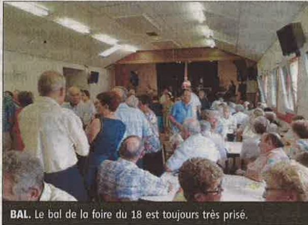
BAL. Le bal de la foire du 18 est toujours très prisé.

Grâce à une nouvelle disposition, le plancher de la salle polyvalente sera bordé de tables et de chaises, afin que chacun puisse passer un bon après-midi et que petits et grands, femmes et hommes, danseurs chevronnés ou occasionnels, puissent, en cette fin de l'été entraîné par un flot musical continu, fêter à leur ma-