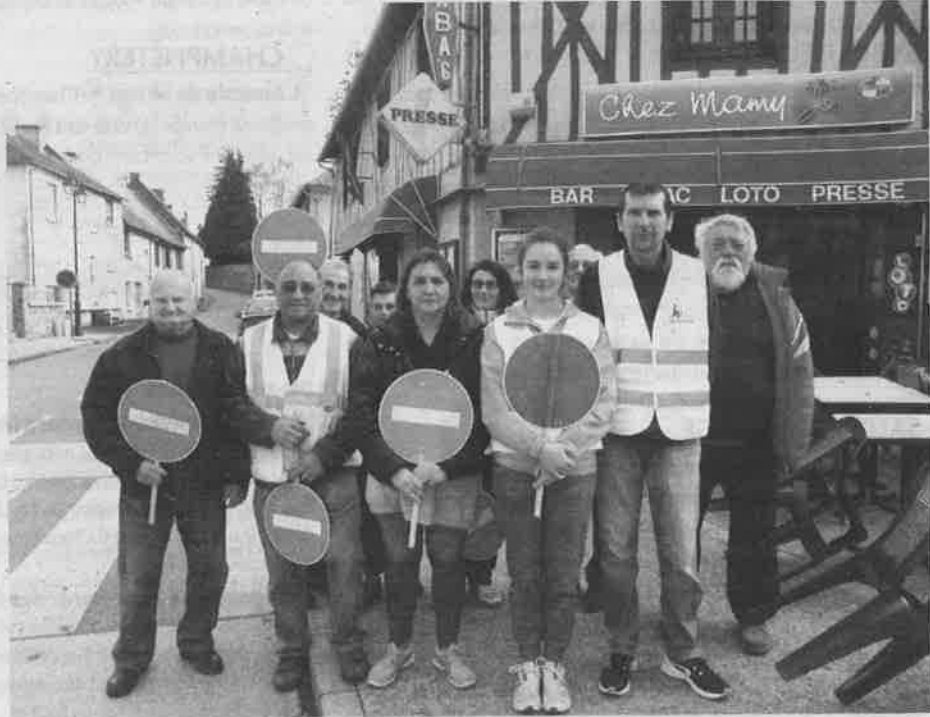
répétition réussie donnait le sourire à tous les participants pour ces courses cyclistes qui et sportive de la commune. donne une image dynamique

Profitant du passage, sur deux tours de circuits des boucles cyclistes de la haute Briance, l'équipe des signaleurs de courses crouzillauds en a profité pour faire une répétition générale en situation réelle avant l'organisation du grand événement des 28 et 29 mai du tour cycliste de Briance Combade dont les 3 épreuves partiront et arriveront à La Croisille ! Autour du maire et d'élus crouzillauds, on notait aussi la présence d'ancien et actuels employés communaux et de nombreux bénévoles fidèles. Bien entendu tous les participants s'accordaient à dire qu'il faudra une mobilisation plus forte d'élus et de bénévoles pour le week-end cycliste de fin mai mais cette première