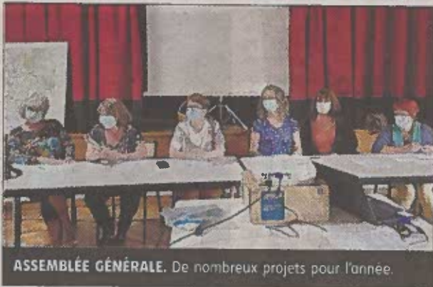
ASSEMBLÉE GÉNÉRALE. De nombreux projets pour l'année.

Voici les projets : 1 à 2 ateliers d'art créatif par mois. Ce-