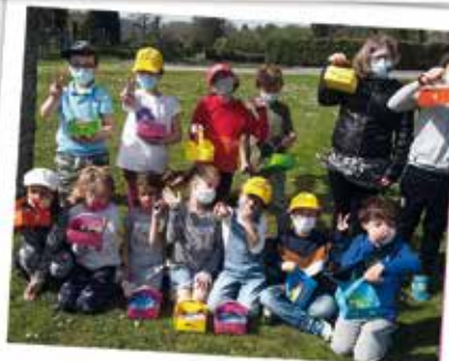
LE RAMASSAGE DES OEUFS DE PÂQUES