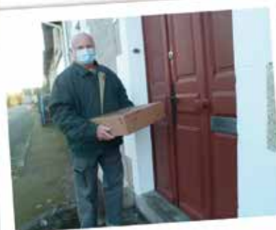
DISTRIBUTION DES COLIS AUX AINES