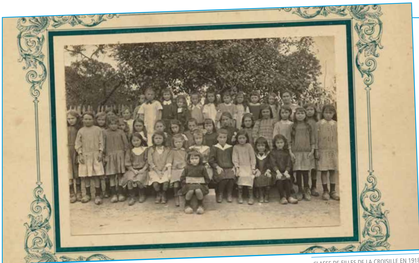
CLASSE DE FILLES DE LA CROISILLE EN 1918