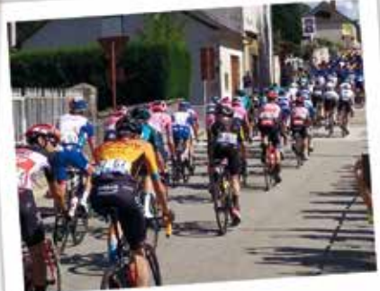
PASSAGE DU TOUR DE FRANCE A LA CROISILLE