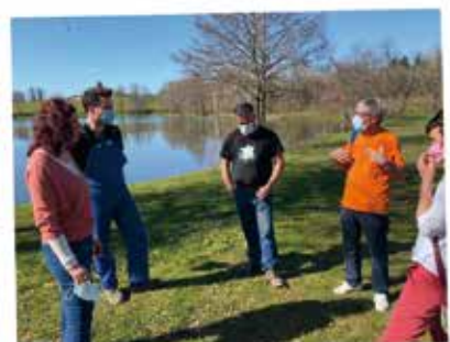
PREPARATION DU 1ER FESTIVAL DE L'ETE 2021