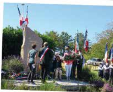
CEREMONIE D'HOMMAGE AUX MAQUISARDS LA 1ERE ADJOINTE DEPOSE LA GERBE DE LA MAIRIE