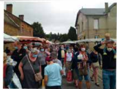
TOUJOURS AUTANT DE MONDE A LA FOIRE DU 18

Durant ces dernières années, plusieurs associations ont montré qu'elles étaient toujours présentes alors que d'autres se sont créées.