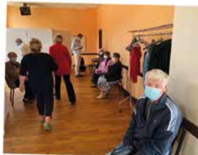
LE CENTRE DE VACCINATION POUR LES PLUS DE 70 ANS