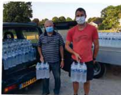
PORTAGE DE L'EAU AUX PERSONNES AGEES LORS DE LA CANICULE