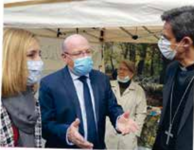
RENCONTRE A LA FOIRE DU 18 DE M LE MAIRE AVEC ME LA DEPUTEE ET MSR L'EVEQUE