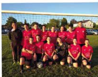
EQUIPE DE FOOT FEMININE ESLCL