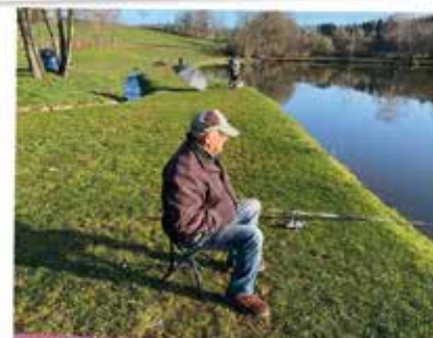
M MULATOUT LE JOUR DE L'OUVERTURE DE LA PÊCHE A NOUAILHAS