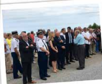
CÉRÉMONIE DE LA BATAILLE DU MONT-GARGAN