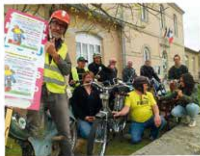
LES ORGANISATEURS DE LA MEULEMANIA DE LA CROISILLE