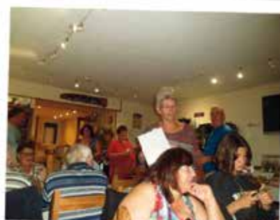
SOIRÉE CARITATIVE CHEZ KEVIN