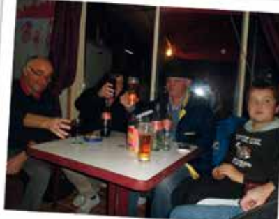
SOIRÉE CARNAVAL AU CROISIL'BAR