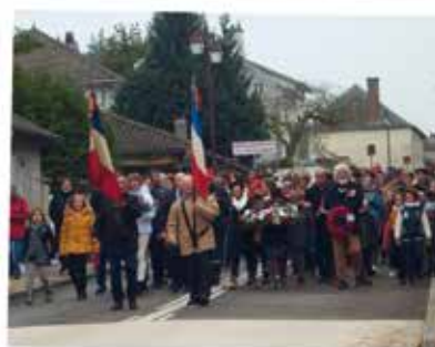
LE DÉFILÉ DU SOUVENIR DU 11 NOVEMBRE 2019