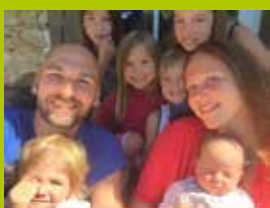
Fam. VAN DE VAERD

Quelles pensées souhaitez-vous encore partager avec les autres Crozillauds? La confiance ! Se faire confiance c'est le plus important dans la vie.