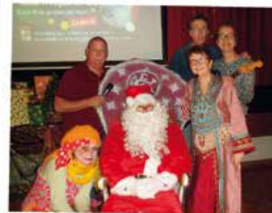
MADAME P REÇOIT LE PÈRE NOËL