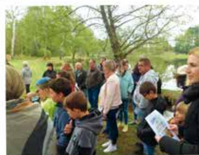
L'INAUGURATION DU PARCOURS DÉCOUVERTE DE LA VIE A L'ÉTANG DE NOUAILHAS