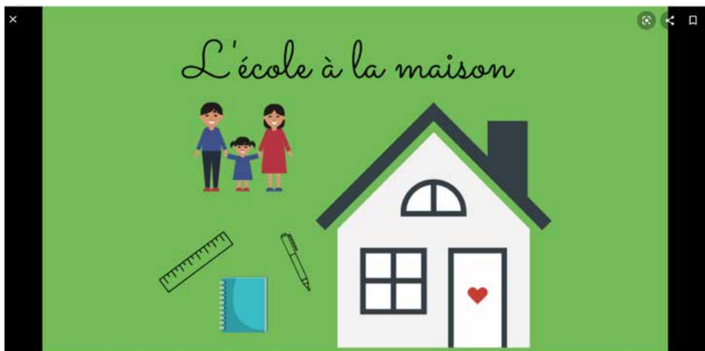
École Sainte Jeanne d'Arc L'école à la maison - École Sainte Jeanne d'Arc