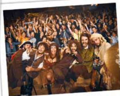
LES HUMEURS CÉRÉBRALES À LA FÊTE DE LA CROISILLE