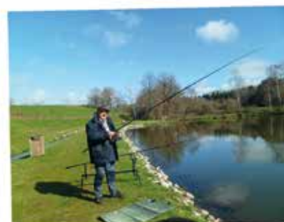
OUVERTURE DE LA PÊCHE 2020 AU PLAN D'EAU DE NOUAILHAS