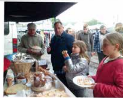
STAND DE L'ÉCOLE À LA FOIRE DU 18