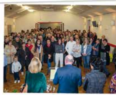
SOIRÉE DES VŒUX DU MAIRE ET DE LA MUNICIPALITÉ 2020

Durant ces dernières années, plusieurs associations ont montré qu'elles étaient toujours présentes alors que d'autres se sont créées.