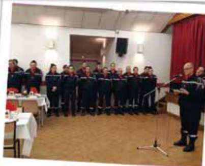
SOIRÉE DE LA STE BARBE À LA CROISILLE DES POMPIERS