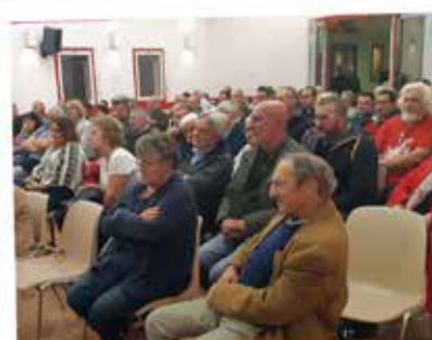
LES CROUZILLAUDS AU CONSEIL MUNICIPAL D'INFORMATIONS SUR L'EAU