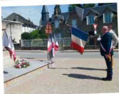
8 MAI 2020 CÉRÉMONIE DU SOUVENIR SANS PUBLIC

A La Croisille sur Brianche, les associations sont dynamiques et variées. Elles permettent de pratiquer des activités, de se retrouver, faire découvrir, enrichir humainement et surtout créer du lien social. Par leur implication globale elles ont su montrer qu'elles sont indispensables au fonctionnement de notre commune.