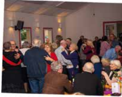
DANSE AU TRADITIONNEL REPAS DES AÎNÉS DU 11 NOVEMBRE