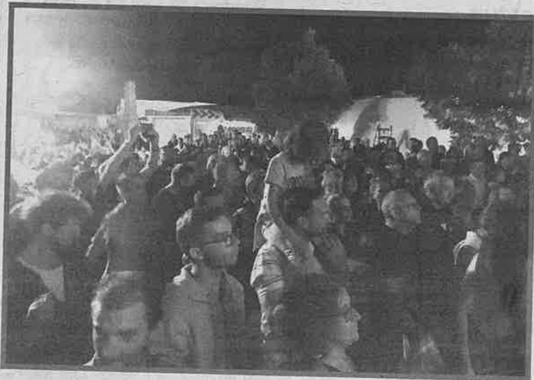
Un nombreux public a assisté au concert.