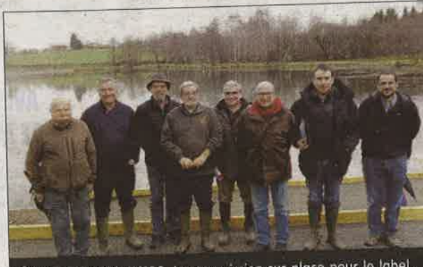
ÉTANG DE NOUAILHAS. La commission sur place pour le label.

Les visiteurs ont notamment regardé si les aménagements réalisés en concertation avec la fédération de la pêche 87 pour l'obtention de la labellisation permettaient bien le développement halieuti-